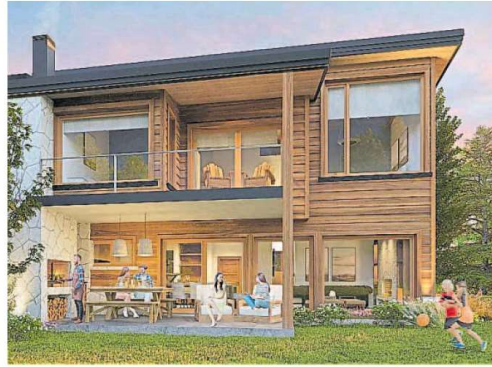
Viviendas. Con amplios jardines y galerías con parilla.