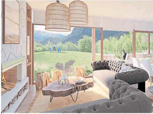
Diseño. Amplios ventanales permiten disfrutar del paisaje patagónico.