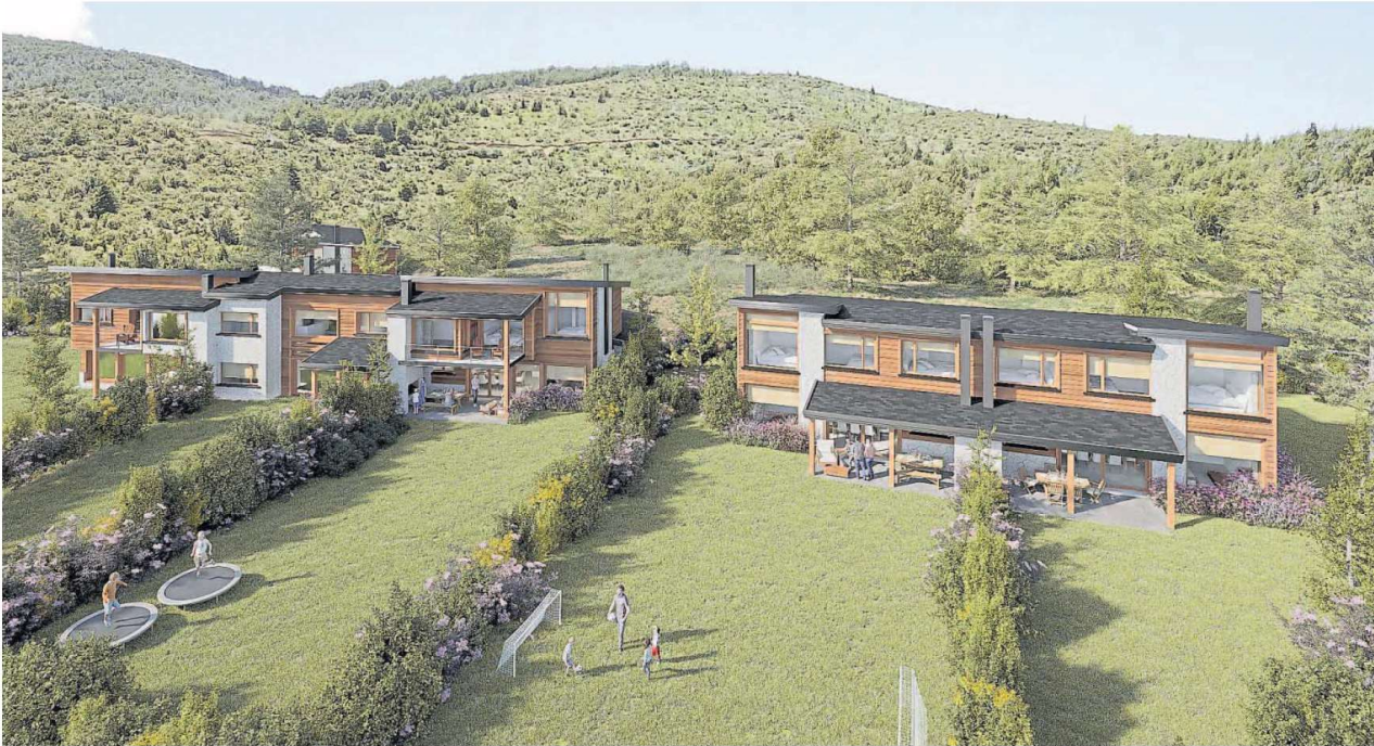
Klover Plaza VIII. Casas llave en mano que se encuentran en el sector de polo de Arelaquen, a metros del club house y con salida rápida al acceso de la ruta 40.