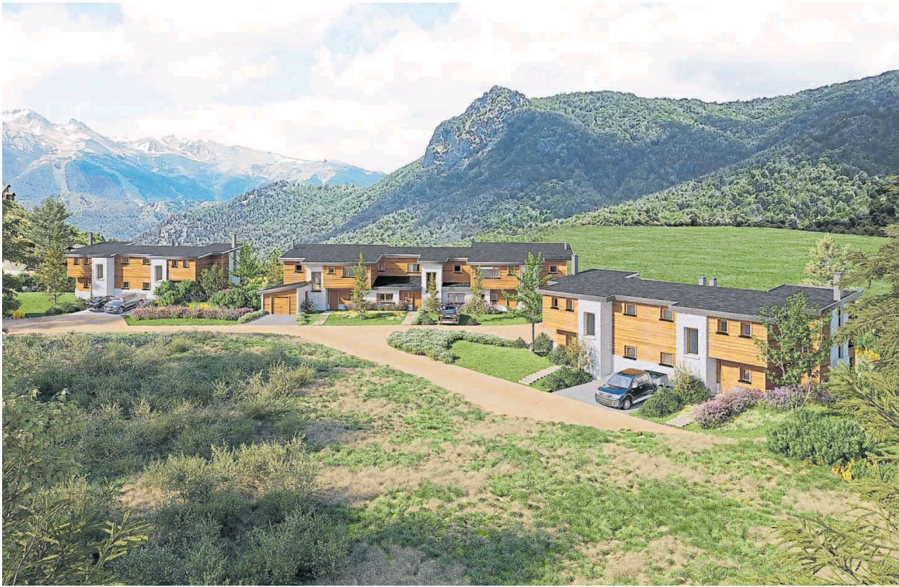
Klover Patagonia VIII. Casas llave en mano que se encuentran en el sector de polo, a metros del club house del country Arelauquen, en Bariloche.