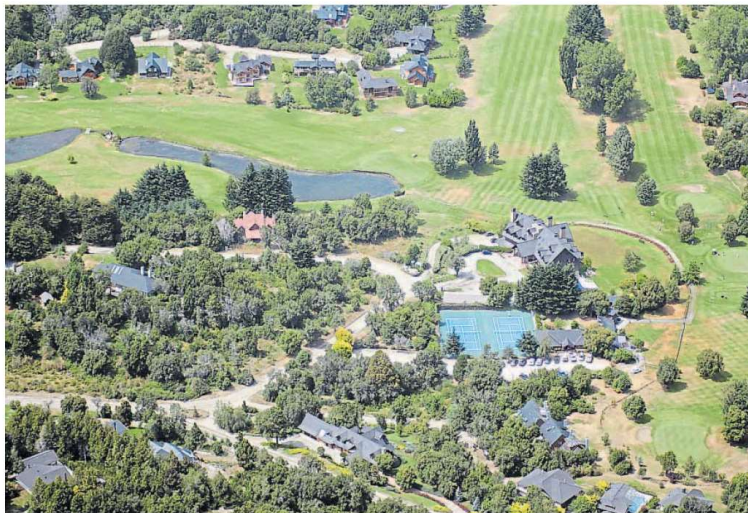
Megaemprendimiento. Arelaquen se extiende en un predio de 800 hectáreas con una atractivo paisaje.

Están desarrolladas en tres módulos independientes: dos módulos tienen dos unidades de cuatro ambientes